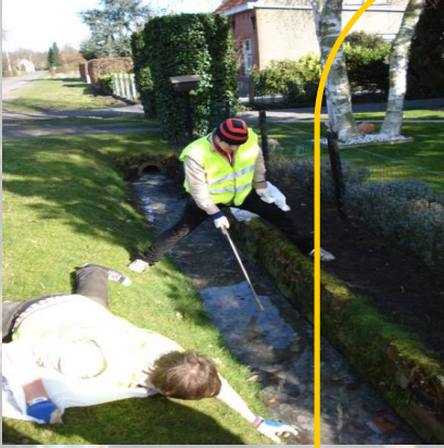
© Maarten Lippens en Michiel Van Hecke